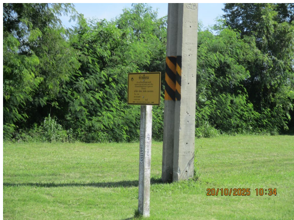
ภาพที่ 2-1 ป้ายแสดงตำแหน่งแนวท่อส่งก๊าซธรรมชาติ