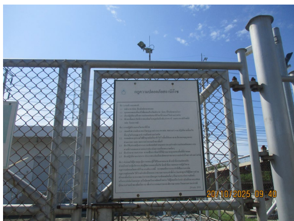
ภาพที่ 2-2 ป้ายแสดงกฎความปลอดภัยสถานีก๊าซ