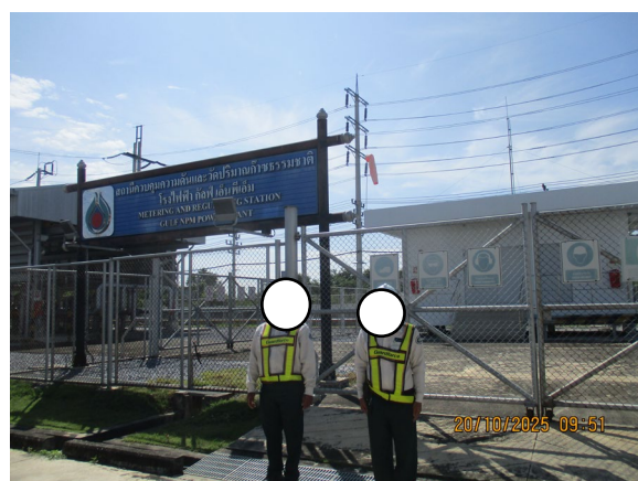
ภาพที่ 2-5 เจ้าหน้าที่รักษาความปลอดภัย บริเวณสถานีวัดและควบคุมแรงดันก๊าซ (MRS)