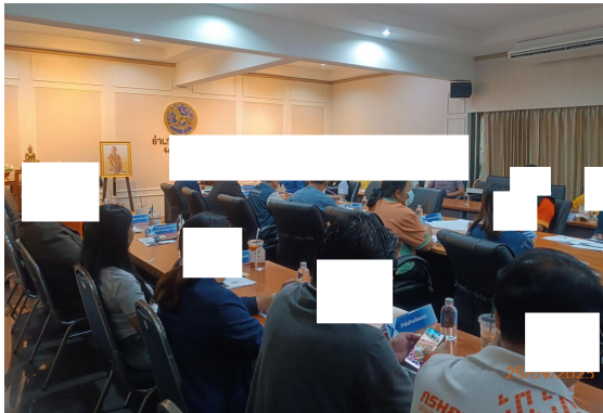
วันที่ 25 กันยายน พ.ศ. 2568