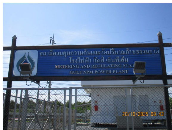
ภาพที่ 2-3 สถานีวัดและควบคุมแรงดันก๊าซ (MRS)