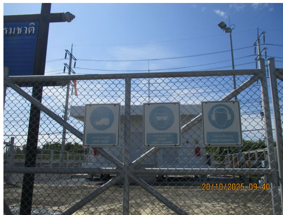
ภาพที่ 2-7 ป้ายเตือนให้สวมใส่อุปกรณ์คุ้มครองความปลอดภัยส่วนบุคคล