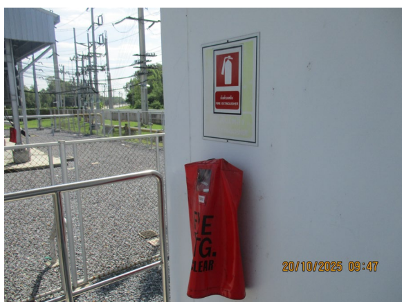
ภาพที่ 2-4 เครื่องดับเพลิงแบบเคมีแห้ง